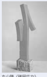
丸山隆《残留応力》1992年

北海道教育大学札幌校で教壇に立った彫刻家、丸山隆の作品と、教え子の作家約20人の作品を展示。