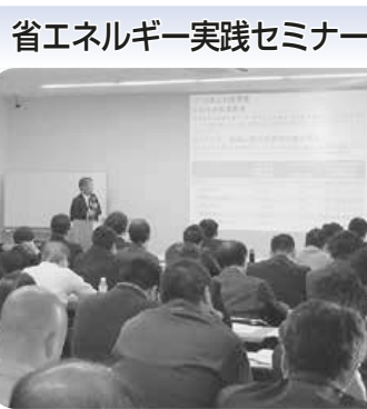
省エネルギー実践セミナー

申込先 市コールセンター(1階) ☎(222)4894 記入し、8月11日(祝)から。(先着)