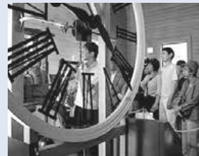
開催時間9時15分～9時30分 このほか、ボランティアによるガイドも随時開催しています