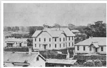
▲建築当時の演武場には授業の開始などを告げる、鐘が設置されていた

現在は「時計台」という名で知られているが、建築当初は塔時計は無く、市民に共通の時刻を知らせるために、後から設置された。130年以上経った今でも、風や雪の影響を除くと、時間のずれはほぼない。