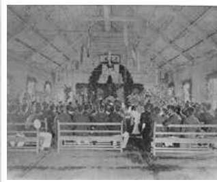
▲1899(明治32)年2階で行われた学位授与祝賀会の様子