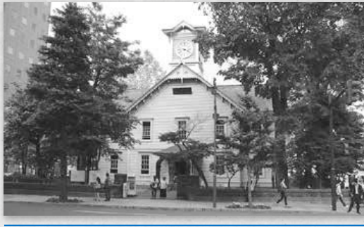
旧演武場のあゆみ