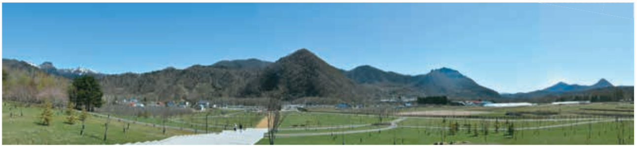
☆掲載写真は、南区のホームページで公開しています。