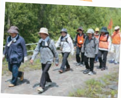
6/30 藻南公園・川沿公園コース 新緑ウォーキング大会