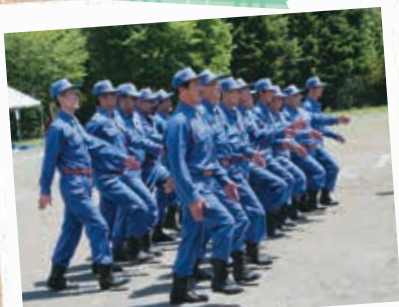
6/18 定山溪中学校 南消防団消防総合訓練大会