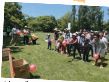
6/17 真駒内公園 世代間ふれあい交流会ウォーキングキャラバン