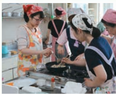
6/23 南区民センター 子育てママの料理教室