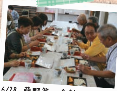
6/28 藤野第一会館 明清高校食物科の生徒が町内会に 手作り弁当を提供