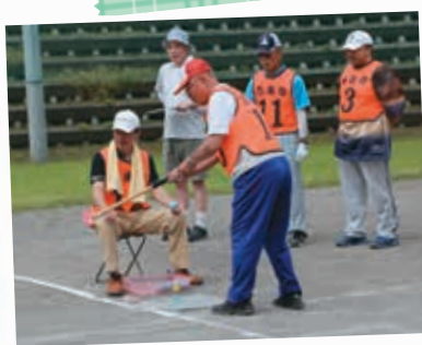
7/2 南の沢小学校 南沢パークリンク大会