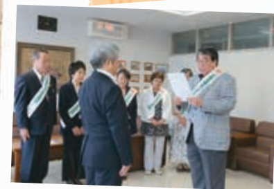
7/3 南区役所 「社会を明るくする運動」 内閣総理大臣メッセージ伝達式