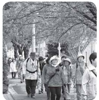
▲▶サクラがちょうど見ごろを迎えていました！