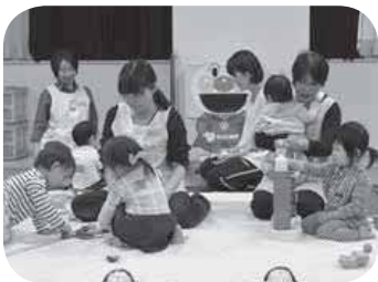
▲子育て講座中の託児