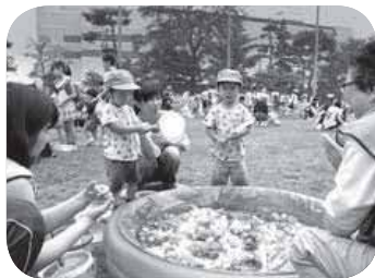
▲イベントで子どもたちと交流