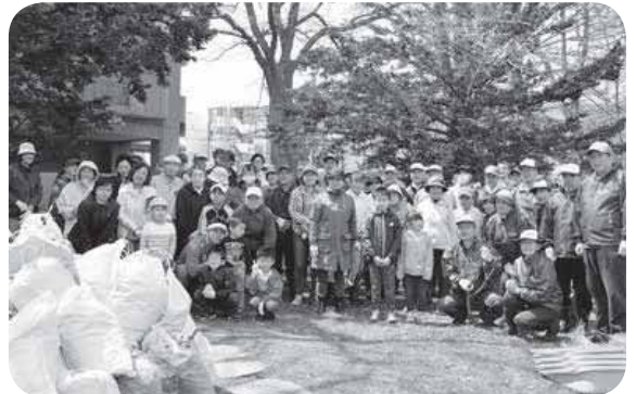
▲どんどんきれいにしていきます ▲集めたごみと一緒に、笑顔で記念撮影♪