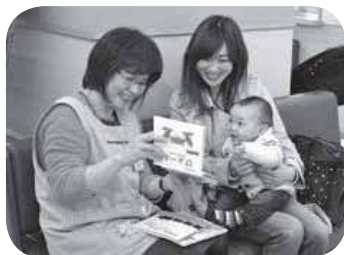
▲健診の待ち時間に絵本の読み聞かせ