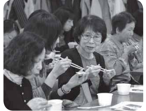
▲減塩アイデア集は保健センターなどで配布中 ▲ミルク豚汁と炊き込みご飯を試食