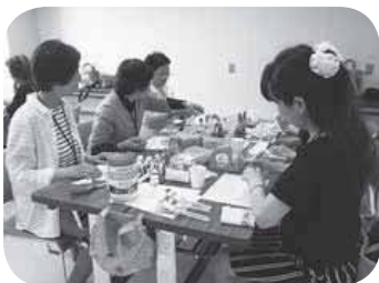
▲イベントなどで使うおもちゃ作り