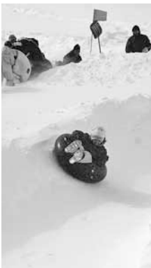
▲平成17～25年まで開催されていたチューブソリ大会

◆ ソリ大会を開催したきっかけを教えてください この場所にはかつて、荒井山スキー場がありました。平成12年をもって営業を終えましたが、この斜面を使わないままではもったいない。有効に活用しようという思いで、全長50mのチューブ滑りのコースを造り、子どもたちに遊ばせたのが始まりです。 ◆ 地域はどのように関わっていますか? コース造りは、毎年なかなかの重労働。そこで活躍するのが若い力です。近隣中学校の生徒たちも作業に加わり、交流を深めながら本番に向け準備しています。作業後は、カレーライスなどでおもてなし。生徒たちの食べる量には毎回圧倒されます。 ◆ チューブソリ大会から段ボールソリ大会に内容を変更したと聞きました。チューブソリ大会では、いかに速く滑り降りるかを競い合っていました。スピードレースも楽しいものでしたが、10回目を迎えるのを機に、住民参加型のソリ大会にすれば地域内の連携意識もより高まり、活動も活発になるのではないかと、「よし、新しい形にしよう!」