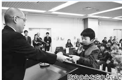
防火の心を忘れないで