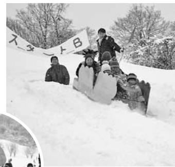
▲今年4回目を迎えた段ボールソリ大会

◆ 手応えを感じますか? 素人が作るとすぐに壊れる可能性があったので、町内会内の大工さんを講師に招き、ソリ作り講習会を開催しています。近隣の小学校も講習会の場所を提供してくれて助かっています。また、中学校の生徒たちも引き続きコース整備に参加してくれるなど、学校も含めた地域全体で大会をつくり上げていこうという思いを感じます。