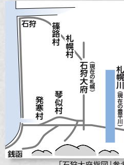
「石狩大府指図」参考

※2月号で掲載した大友亀太郎の功績の中で「大野平野(現在の北斗市の一部、七飯町、大磯町)の開拓」と記載しましたが、正しくは「大野平野(現在の北斗市の一部、七飯町)の開拓」です