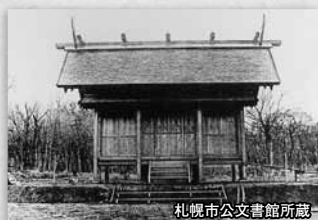
◀建築当時は札幌神社という名前だった

島は開拓の守護神を祭る神社の建設地を、街を一望できる円山に決定。後任の岩村通俊が1871年に社を完成させました(1964年に北海道神宮に改称)。