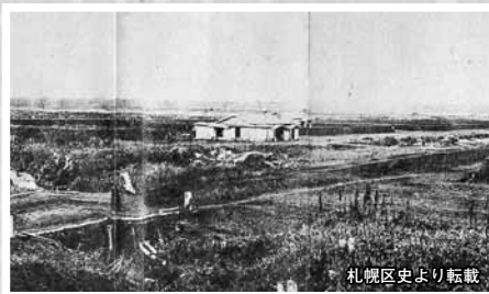
▲1871年の札幌。中央の家屋は島の官邸とされている