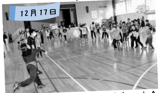
手稲中央小おやじの会ドッジボール大会