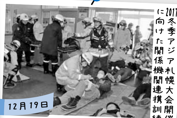
2017 冬季アジア 札幌 関係機関 連携大会 開催 訓練