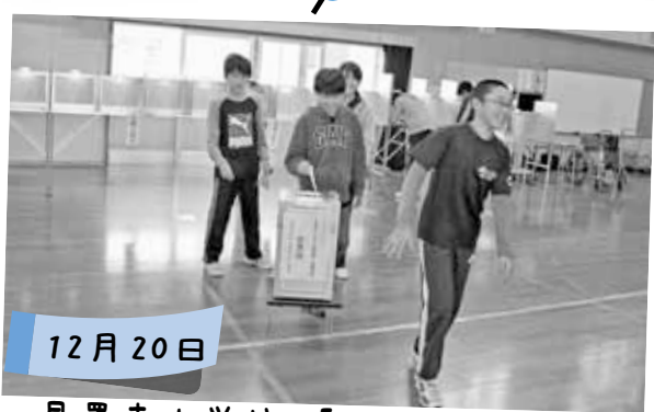
星置東小学校で「せんきょ体験授業」