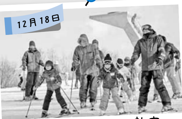
手稲山親子スキー教室