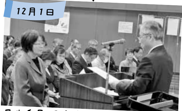
民生委員・児童委員への委嘱状伝達式