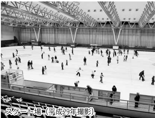
スケート場 (平成29年撮影)

今月の「ひがしくあのころ」は、「美香保体育館」です。 昭和45年(1970年)に「美香保屋内スケート競技場」として完成し、札幌冬季オリンピックをはじめ、アジア冬季競技大会などで公式競技の会場として利用されました。 昭和47年(1972年)のオリンピック終了後に、「美香保体育館」と改称し、現在は、夏季(6月から9月)は体育館、冬季(11月から4月)はスケート場として市民に一般開放されています。 2017冬季アジア札幌大会ではアイスホッケー会場*として利用されます。 *詳しくは、「区民のページP3」をご覧ください。