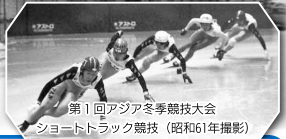
第1回アジア冬季競技大会