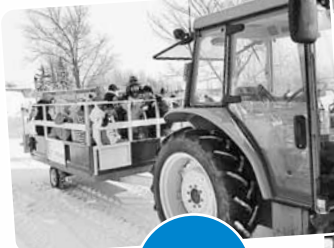
トラクター遊覧車