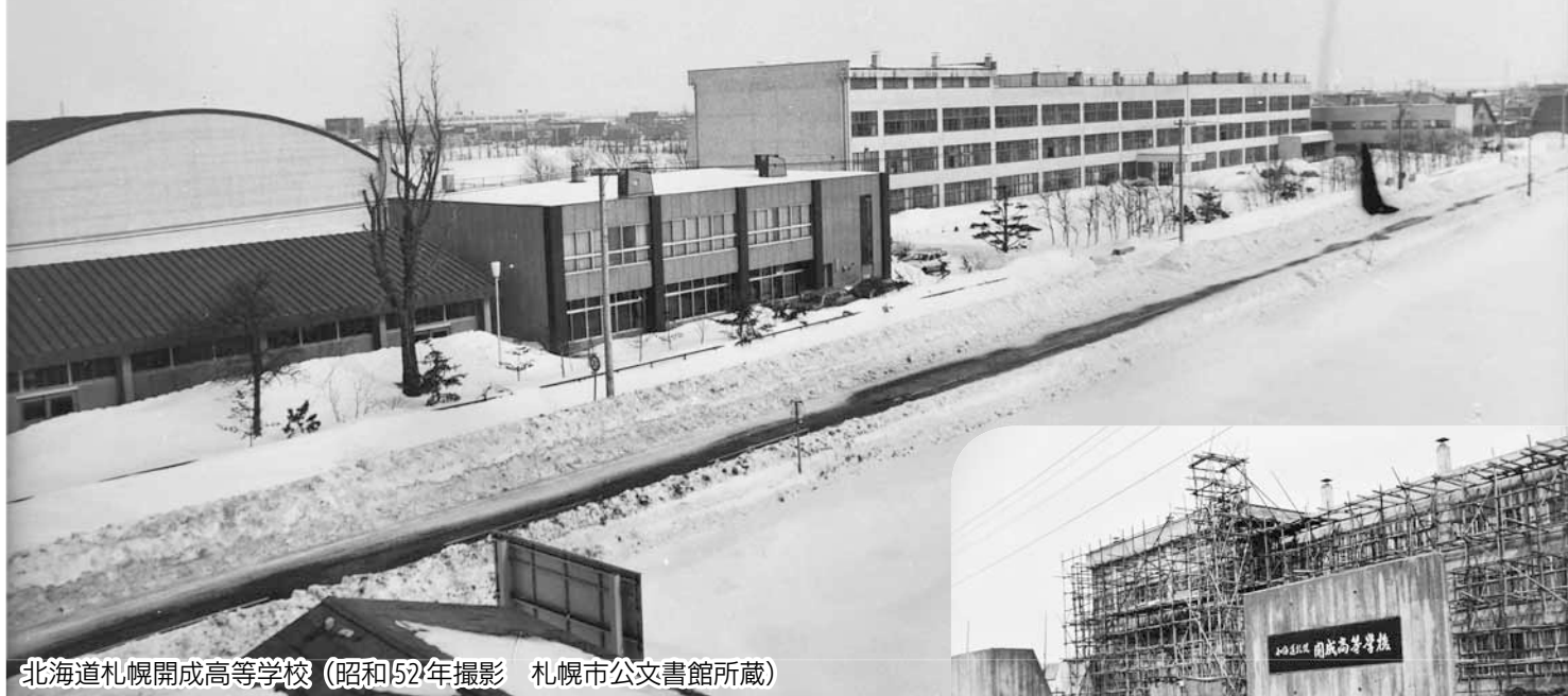
北海道札幌開成高等学校 (昭和52年撮影 札幌市公文書館所蔵)