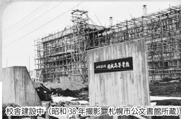
校舎建設中 (昭和38年撮影)