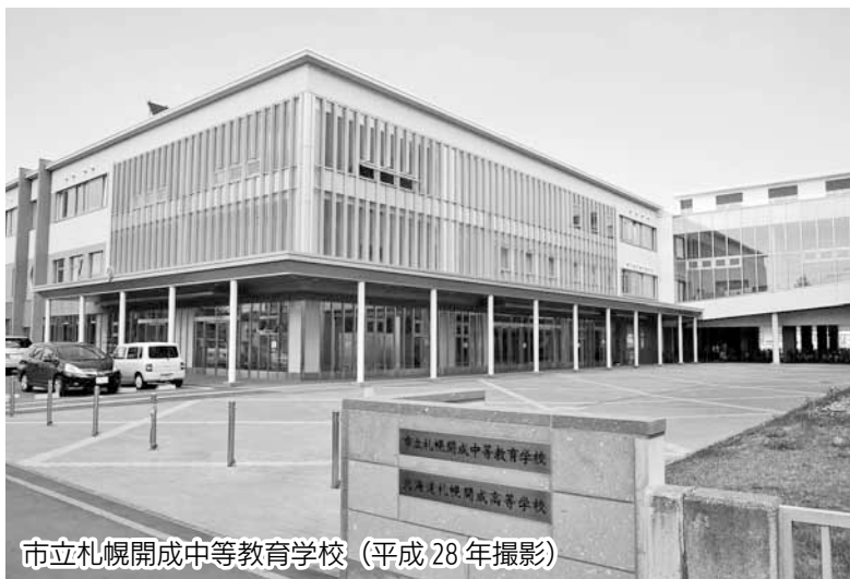
市立札幌開成中等教育学校 (平成28年撮影)