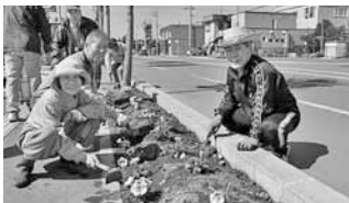
三角点通のフラワーロード苗植え会