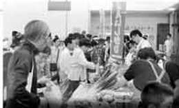
昨年の『さとの夏祭り』。今年は8/6(土)・8/7(日)開催。

東区は、市内で3番目に農家戸数が多く、タマネギの主要産地でもあります。タマネギ栽培の発祥地として、特にタマネギについて理解を深めてほしいですね。