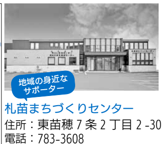
地域の身近なサポーター 札苗まちづくりセンター 住所：東苗穂7条2丁目2-30 電話：783-3608