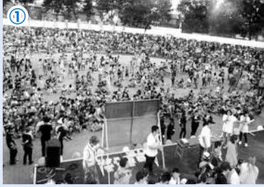
①昨年の「燃えれ!わが街」の様子。 2日間で約2万人が訪れ、交流を深めました。 今年は8月6日(出)、7日(回)に開催。 ②龍神太鼓に合わせて披露される龍の舞。