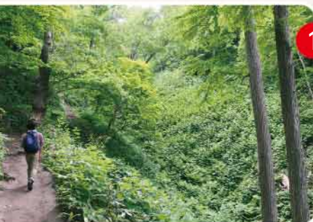
▲ すぐ脇には手付かずの自然が残る