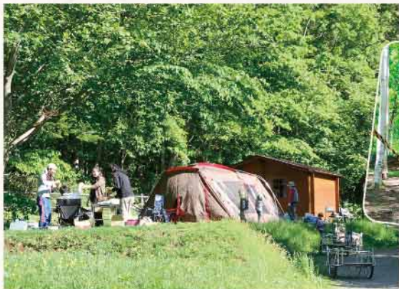
▲子どもが楽しめるアスレチックもあります

定山溪の豊かな自然に囲まれた、通年で利用できるキャンプ場。テントサイトやコテージ、移動式住居のゲルを連想させるテントハウスから選択でき、自然の中ならではの体験活動が人気の施設です。