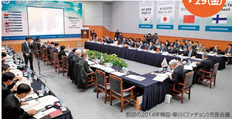
前回の2014年韓国・華川(ファチョン)市長会議

世界冬の都市市長会議が、7月27日(水)～29日(金)にコンベンションセンターで開催されます。 この会議は、積雪、寒冷という気候条件が共通する世界の都市が集まり、冬の都市の特徴を生かしたまちづくりを学び合うもの。昭和57年に札幌で始まって以降、2年に1度行われており、本市では34