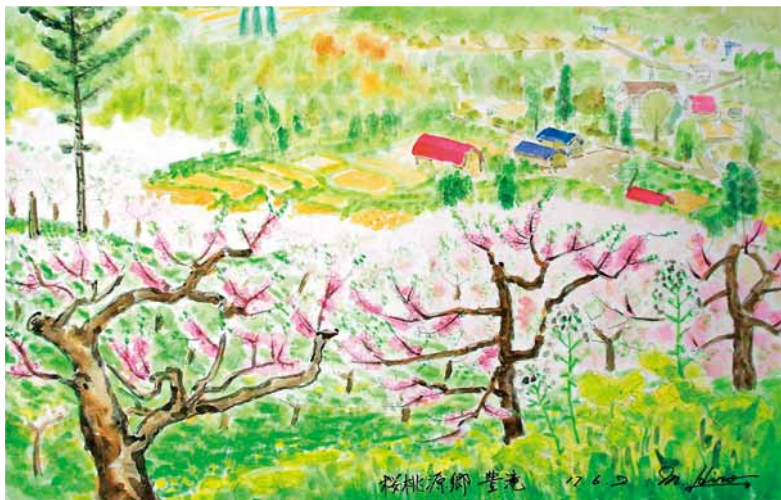
☆掲載写真は、南区のホームページで公開しています。