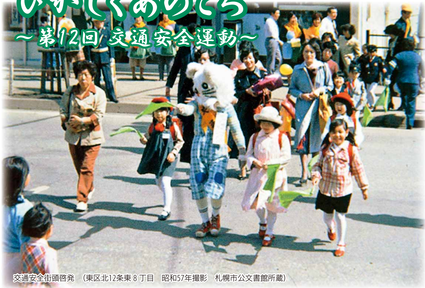
交通安全街頭啓発 (東区北12条東8丁目 昭和57年撮影 札幌市公文書館所蔵)