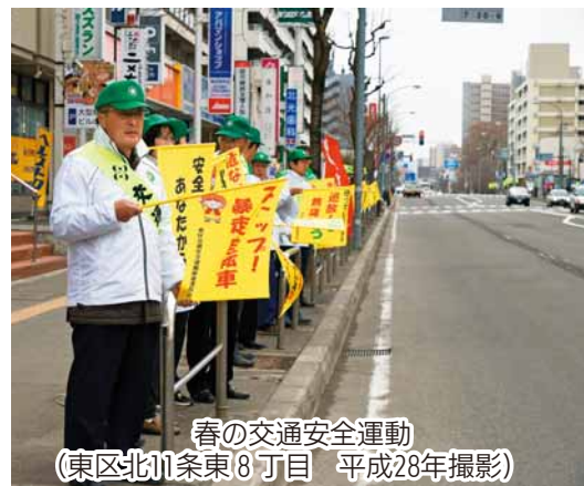
春の交通安全運動 (東区北11条東8丁目 平成28年撮影)