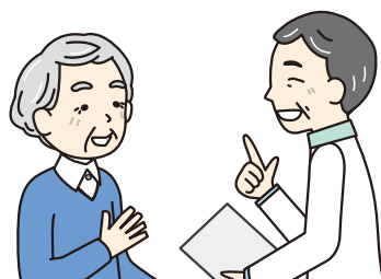
福祉に関する心配事の相談や解決のお手伝い