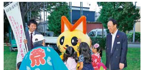
▲町内会参加促進活動

住民が主体的に取り組むまちづくり活動を、まちづくりセンターを拠点として支援するとともに、地域のまちづくりの担い手である町内会の振興を図るため、参加促進に対する支援を行います。