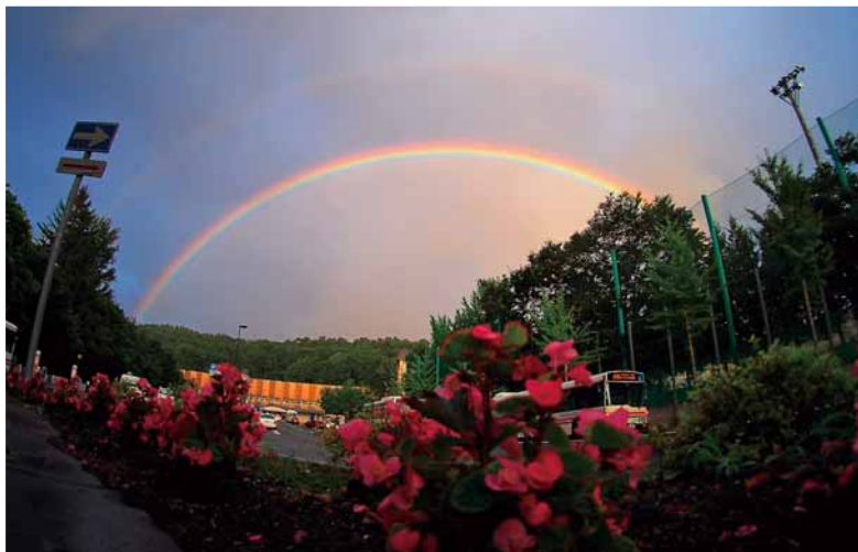
☆掲載写真は、南区のホームページで公開しています。