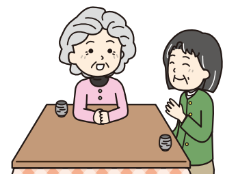
地域の援助を必要とする人の状況などの把握