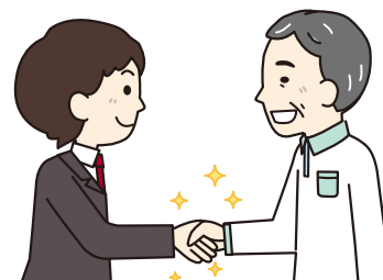
区役所や保健センターなど関係機関への協力・連携