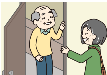
ひとり暮らしの高齢者への声掛けなどの見守り活動

決して専門家ではありませんが、さまざまな困り事を皆さんと一緒に考えサポートします。