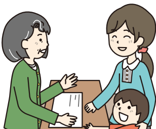
子育て中の保護者の方の悩み相談