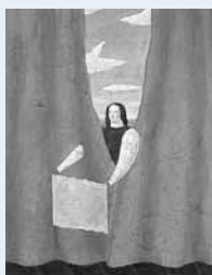
ある経験 1979年 ©YOKO ARIMOTO