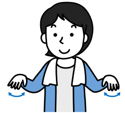
手首と足首を回します