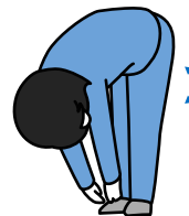
太ももの裏側を伸ばします