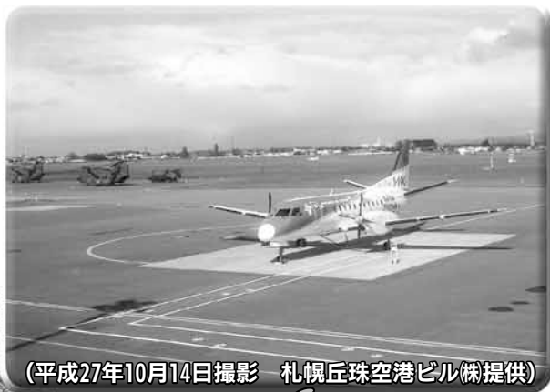
(平成27年10月14日撮影)

1942（昭和17）年に旧陸軍が飛行場を設置し、その後、陸上自衛隊の専用飛行場となり、1961（昭和36）年に公共用施設として民間機の乗り入れが始まりました。正式名称は「札幌飛行場」ですが、通称「丘珠空港」と呼ばれ、札幌の空の玄関口として、また道内および東北を結ぶ拠点として重要な役割を担っています。