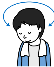
首を左右にゆっくり回します