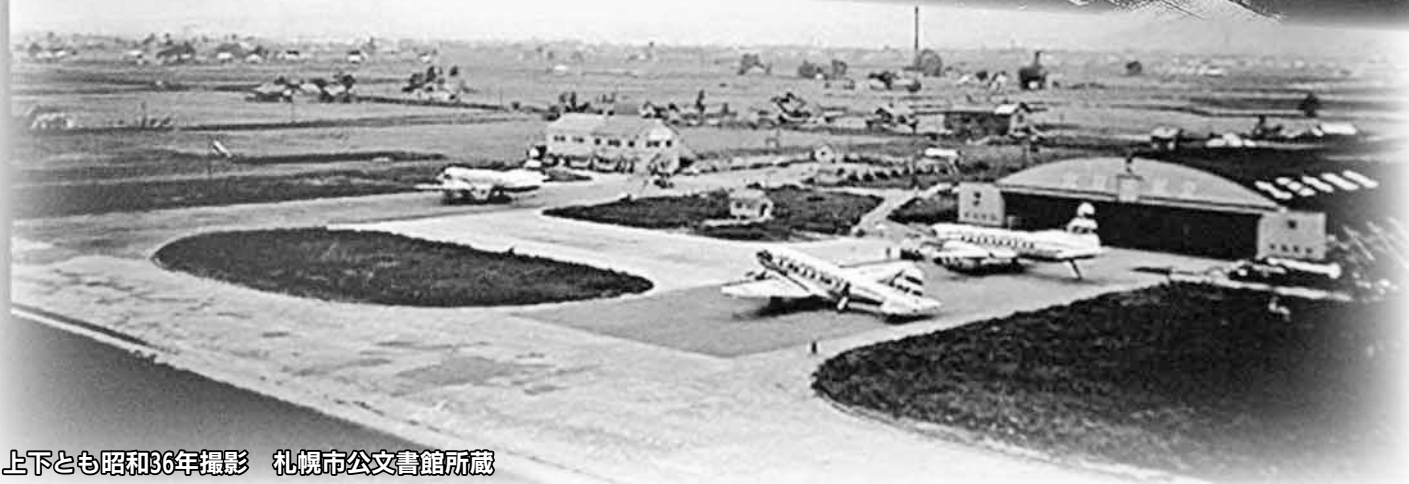
上下とも昭和36年撮影 札幌市公文書館所蔵