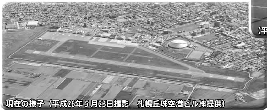
現在の様子 (平成26年5月23日撮影)