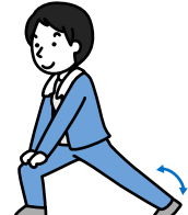
アキレスけんを伸ばします