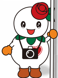
マスコットキャラクター 「しろっぴー」