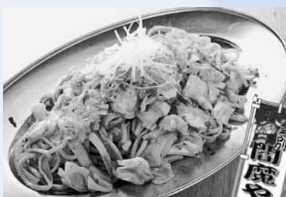
登別閻魔やしそばは、こののぼりがある登録店舗で食べられます▶

道産小麦の平麺に、指定のタレや地元の食材を使って調理したご当地グルメです。ゴマの効いたピリ辛のタレが麺にからみ、思わずやみつきになるおいしさ！