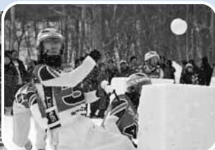
試合時間は3分。相手チームのフラッグを奪うか、どちらかが全滅した時点で勝敗が決まる

日2/20(土)8時～15時45分=予選リーグ、21(日)8時30分～16時=決勝・準決勝リーグ 所昭和新年山麓特設会場(壮警町字昭和新年) 問同実行委員会 ☎0142-66-2244