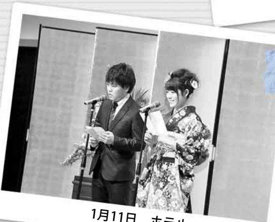
1月11日 ホテルエミシア札幌