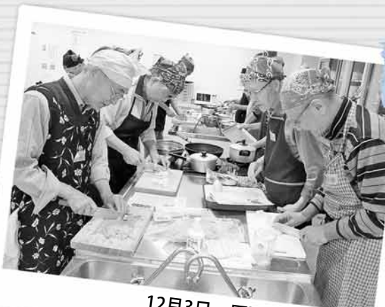
12月3日 厚別区民センター