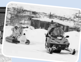
▲スノーモービルに引かれるバナナボートはスリル満点!