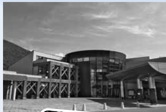
白滝の黒曜石は質・量共に日本一といわれています