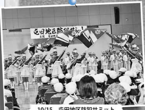
10/15 屯田地区防犯サミット ～屯田地区センター