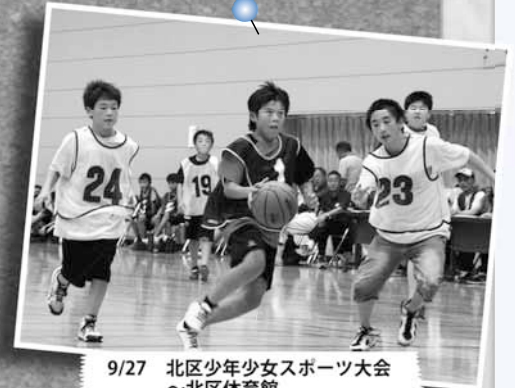
9/27 北区少年少女スポーツ大会 ～北区体育館