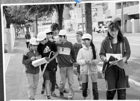
9/29 北九条小学校「子ども安全マップ」作成 ～同校周辺