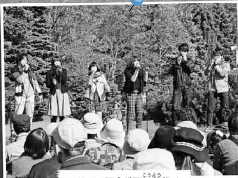
10/17 百合が原紅葉祭り ～百合が原公園