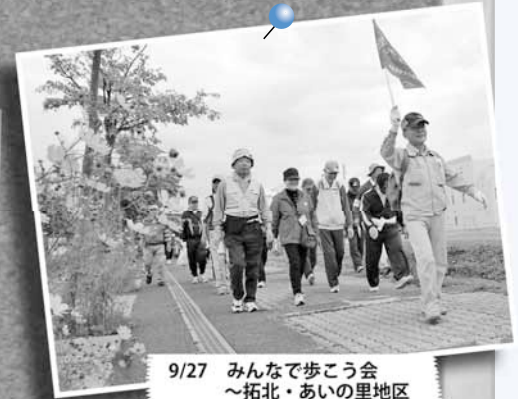
9/27 みんなで歩こう会 ～拓北・あいの里地区