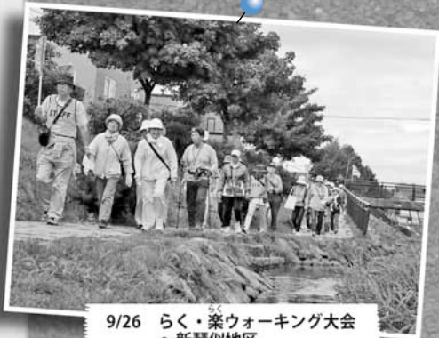
9/26 らく・楽ウォーキング大会 ～新琴似地区