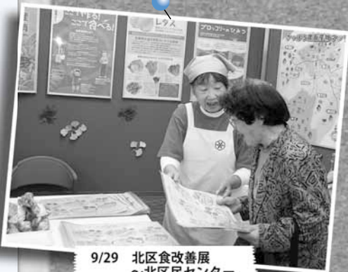
9/29 北区食改善展 ～北区民センター