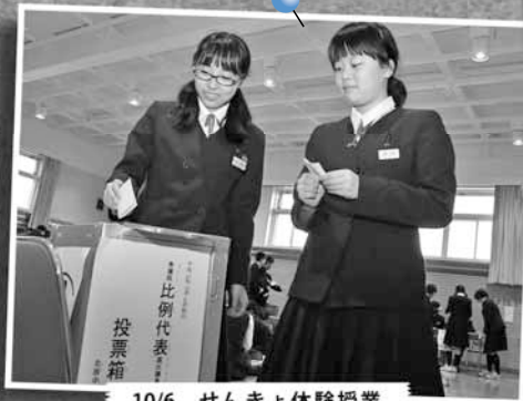
10/6 せんきょ体験授業 ～北辰中学校