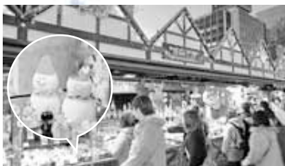
↑シナモンが香る 温かい赤ワイン