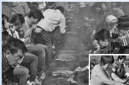
豪快なさんまのつかみ取りも開催▶

マグロのトロに匹敵するほど脂が乗ったさんまを堪能できます。毎年大人気の炉端焼きは、皿と箸のセット(100円)を購入すると、さんまが無料で食べ放題! ザンギ、丼物などのさんま料理の販売もあります。旬のさんまを心行くまで食べ尽くそう!