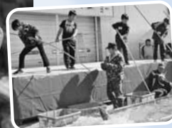
▲専用の釣りざおを使うサケ釣り大会は大盛り上がり!

徳川幕府にも献上された極上の西別鮭が主役のお祭り。1枚1枚身がほぐれる食感が特徴で、串焼き、あきあじ鍋などの料理で楽しめます。ちびっこサケ釣り大会など参加型の催しもありますので、秋の行楽にぴったり!