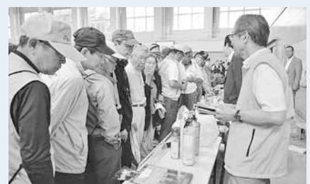
平成26年度の防災訓練