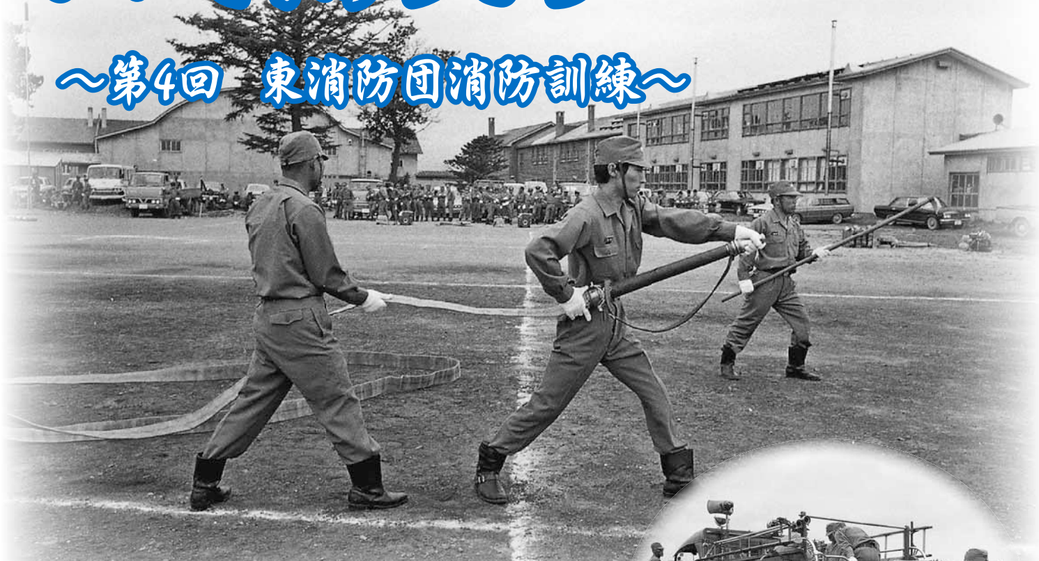
東消防団の訓練の様子 (札幌小学校 昭和49年6月撮影)