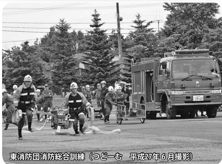
東消防団消防総合訓練 (つどいむ 平成27年6月撮影)