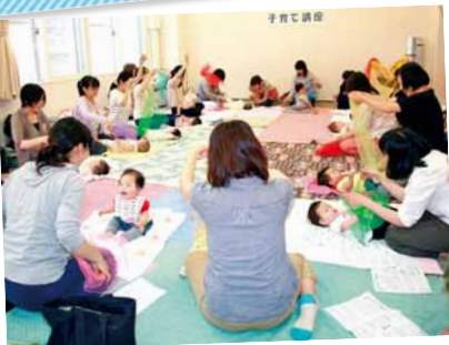
歌でコミュニケーションを♪

わらべ歌を学ぶ親子向けの講座が二十四軒団地集会所（二十四軒3-5）で行われました。お母さんの歌に赤ちゃんもニッコリ。