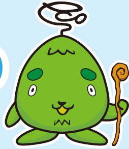
西区環境キャラクター さんかくやまベエ