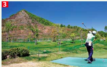
1. 外でみんなと食べるバーベキューの味は格別 2. いろいろな遊具があるので子どもたちも大満足 3. 広々とした開放的なコースで、気持ちよくプレーできる