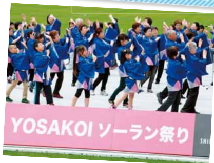
八軒音頭を舞い踊る

YOSAKOIソーラン祭りの白い恋人パーク会場（宮の沢2-3）で、おそろいの法被を着た地域住民が八軒音頭を披露しました。