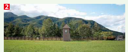
1. 「芝生広場」から自分の家が見えるかも 2. 天気の良い日に絶好の散策コース