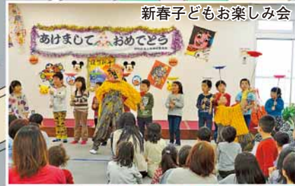
新春子どもお楽しみ会

高齢者を支える見守り活動のほか、子ども同士や地域の大人が触れ合える交流の場をつくっています。