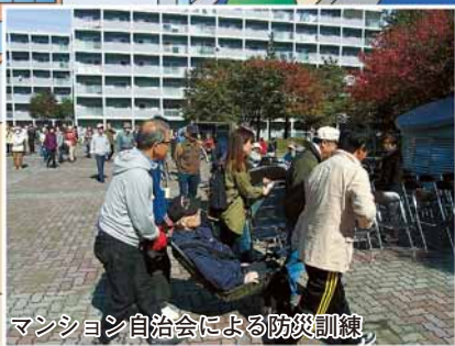
マンション自治会による防災訓練

いつ起こってもおかしくない災害に備え防災訓練を行ったり、犯罪抑止に効果のある防犯パトロール、交通安全運動など地域の安全を守っています。