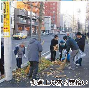
歩道上の落ち葉拾い