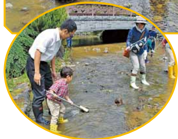
▶僕もきれいにしよう!