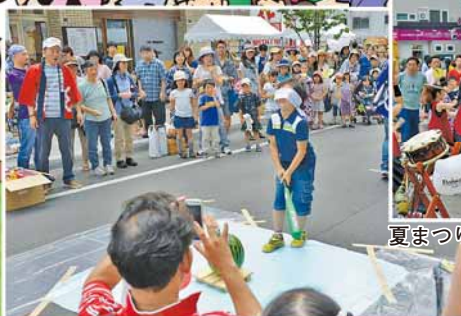
夏まつりだ 裏参道