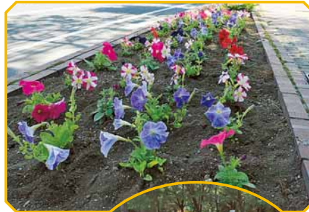
▶花の色のバランスも考えて植えていきます