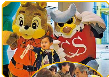
▶危険物安全週間です。身近な危険物の事故に気を付けてください