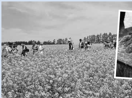
▲黄色の花と青空の対比が美しい畑の中を思う存分散歩できます

日所 5/30(土)、31(日)10時～16時、丸加高原(滝川市江部乙町3949) 問 同実行委員会 ☎0125-23-0030