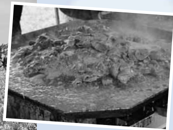
▲滝川市は味付きジンギスカン発祥の地。会場では地元の名店のジンギスカンが味わえます