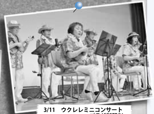
3/11 ウクレレミニコンサート ～プラザ新琴似