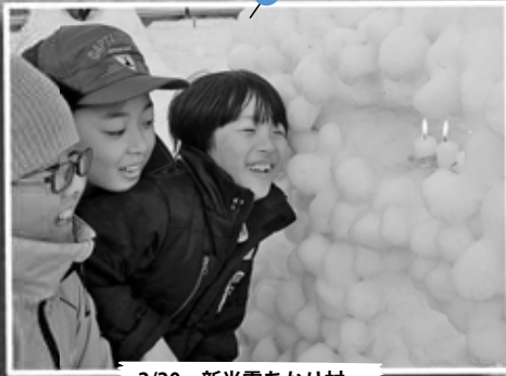
2/20 新光雪あかり村 ～新光小学校