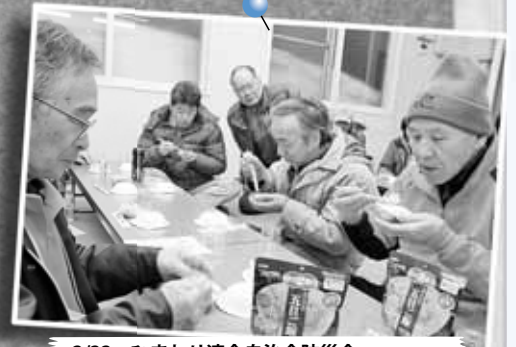
2/22 ひまわり連合自治会防災会 冬季防災（炊き出し）訓練～拓北ひまわり会館