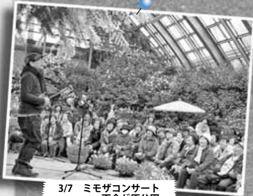
3/7 ミモザコンサート ～百合が原公園