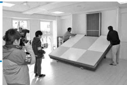
可動式のステージは電気を使わないで動かす仕組みです！

4月1日、北地区に定員60人でオープンしました。昨年12月に、開園前の様子取材してきました！