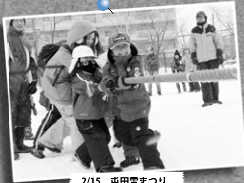
2/15 屯田雪まつり ～屯田みずほ東公園