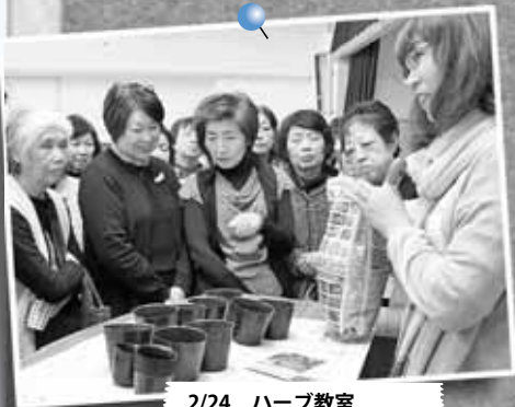
2/24 ハーブ教室 ～新琴似三和福祉会館