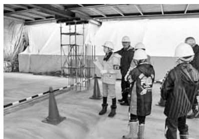
取材した日は、ちょうど3階の床が完成したところでした

トイレの照明は人を感知して点灯したり、屋上にはソーラー発電パネルがあったり、暖房（ボイラー）は燃料に木くずを使っているなど、エコな設備がたくさん。