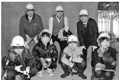
取材にご協力いただいた工事現場の皆さんと一緒にパチリ♪

札幌市では、高齢者の人口が年々増えていて、施設で専門的な介護が必要な人のために、高齢者施設の整備を計画しています。北区では、新たに「特別養護老人ホーム『七色の風』」が建設されます。