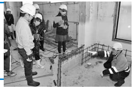
浴室になるスペースを見学中!

7月1日、屯田地区にオープンします。定員は80人。1月に工事の様子や、施設の特長などを取材してきました!取材した日は内部の工事が進んでいました。