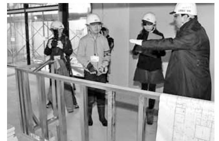
料理ができる場所にはカウンターになる骨組みが取り付けられていました

施設の名前は、ひとりひとりが、さまざまな色に輝きながら生活することができるようにと願って付けました。