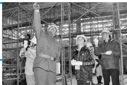
体育館工事の様子をていねいに説明してもらいました