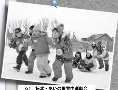
3/1 拓北・あいの里雪中運動会 ～拓北小学校