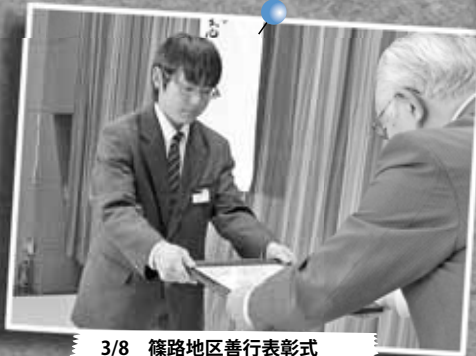
3/8 篠路地区善行表彰式 ～篠路コミュニティセンター