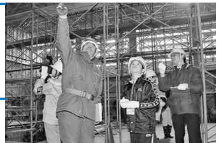
体育館工事の様子をていねいに説明してもらいました