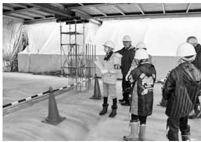
取材した日は、ちょうど3階の床が完成したところでした

トイレの照明は人を感知して点灯したり、屋上にはソーラー発電パネルがあったり、暖房（ボイラー）は燃料に木くずを使っているなど、エコな設備がたくさん。