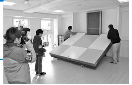
可動式のステージは電気を使わないで動かす仕組みです！

4月1日、北地区に定員60人でオープンしました。昨年12月に、開園前の様子取材してきました！