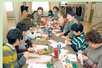
↑手芸同好会の活動中。卒業式で使う胸花を作っているところです。

講義以外にもさまざまな課外活動があります。学園生をまとめる学生会や、学園新聞を発行する新聞部、有志でつくるカラオケや卓球などの同好会があり、自分に合った活動ができます。