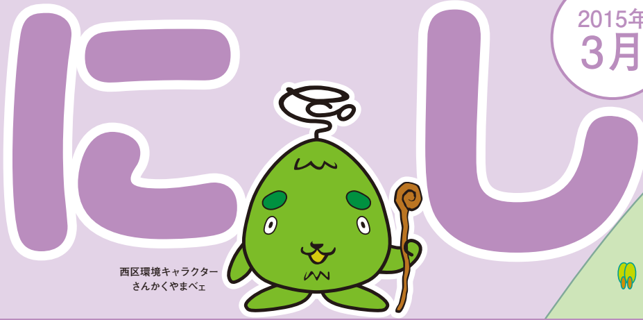
西区環境キャラクター さんかくやまベエ

区民のページで取り上げてほしいテーマなど、 皆さんからのご希望やご意見をお寄せください。 はがき、ファクスまたは西区ホームページの 「ご意見・ご要望」フォームをご利用ください。