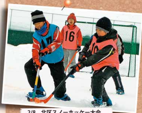
2/8 北区スノーホッケー大会 ～麻生球場