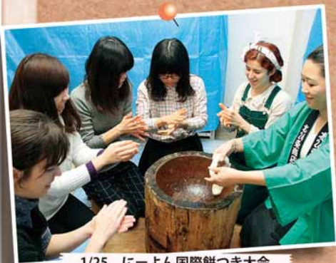
1/25 にーよん国際餅つき大会 ～梶北寺