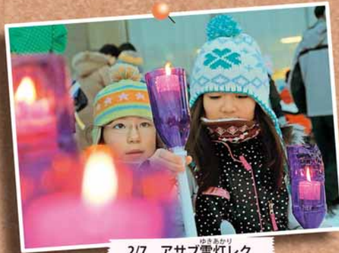
2/7 アサブ雪灯レク ～麻生緑地