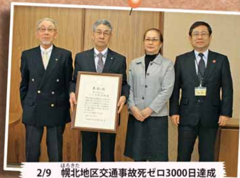
2/9 幌北地区交通事故死ゼロ3000日達成 ～北区役所