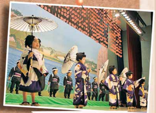
1/30 篠路子ども歌舞伎伝承式 ～篠路コミュニティセンター