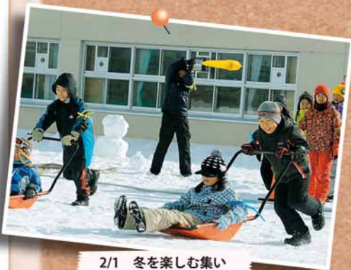
2/1 冬を楽しむ集い ～新陽小学校