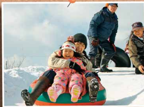
2/7 新琴似スノーフェスティバル ～新琴似中央公園