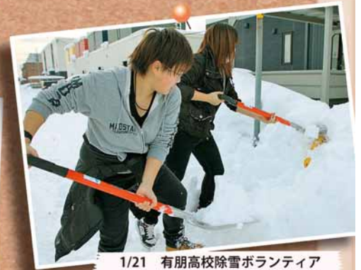
1/21 有朋高校除雪ボランティア ～屯田地区