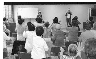
▲介護予防センターで開催している健康教室。認知症予防には手足の運動が効果的です。

ご家族と話がかみ合わなくなったり、お友達が閉じこもりがちになったなどの心配事があれば、お気軽にご連絡ください。地域の方や関係機関と協力してサポートしていきます。