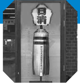
東区役所1階ロビーに飾られている「まとい」

明治27（1894）年に札幌村青年会附属消防組として誕生。 現在は269人の団員により1本部、10分団で構成されています。 平成17（2005）年2月には、長年にわたる功績と高い消防技術が認められ、 日本消防協会から消防団の最高栄誉である特別表彰「まとい」が贈られました。