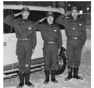
みやぎ宮崎班長（中央）をはじめ、機敏な動作の鉄東分団の皆さん