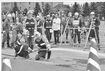
消防団員による消火訓練