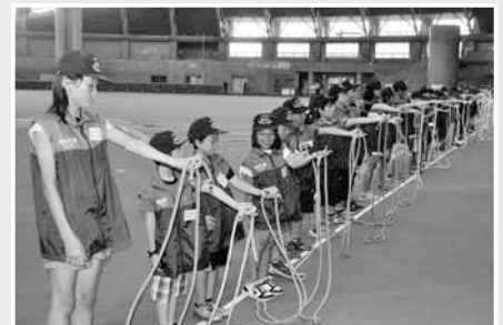
少年消防クラブ員によるロープ結索訓練