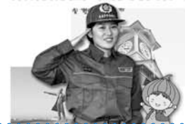
消防団員募集ポスター