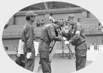
優勝した分団に優勝旗が贈られます