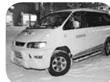
危険な場所を注意深くパトロール

火災発生の危険性が高い年末年始に、放送で防火などを呼び掛けながら、地区内を回ります。