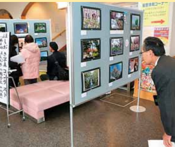
▲ほしおき写真コンテストの表彰式に併せ、受賞作品36点を集めた写真展が開催されました (11月23日)。