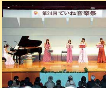
▲第24回ていね音楽祭が開催され、20団体がさまざまなジャンルの歌や演奏を披露しました (12月7日)。