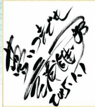
手稲区親善大使 三浦 雄一郎