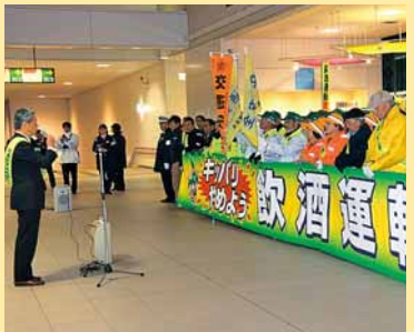
▲飲酒運転根絶キャンペーンがJR手稲駅自由通路「あいくる」で実施されました (11月19日)。