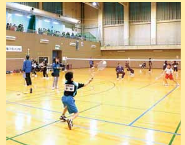
▲第22回手稲区小学生バドミントン大会が開催され、小樽、石狩の小学生を含む102人が参加しました (11月22日)。