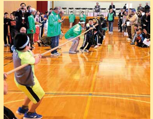
▲新発寒地区青少年育成委員会主催の「綱引き大会」が新陵小学校で開催され、参加した22チームが熱戦を繰り広げました (12月7日)。