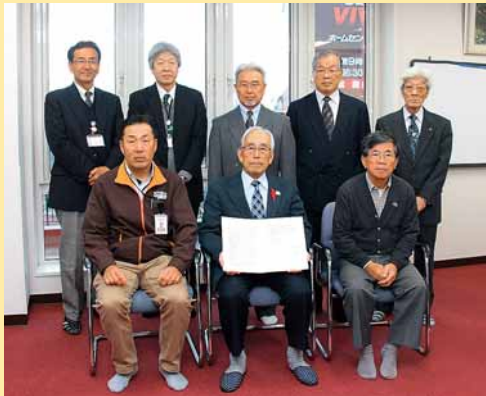
▲富丘西宮の沢連合町内会連絡協議会が、スーパービバホーム手稲富丘店の協力を得て、10月30日から同店を災害時の地域の避難場所としました。

人口140,767人 (前月比+23) 世帯数58,000世帯 (前月比+17) 平成26年12月1日現在