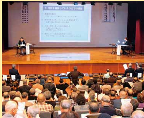
▲災害時要援護者避難支援講演会が開催され、参加した約260人が、地域での支え合いについて理解を深めました (11月26日)。