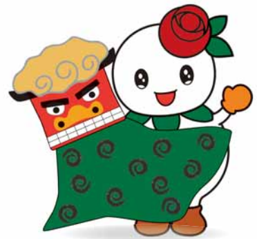
マスコットキャラクター「しろっぴー」