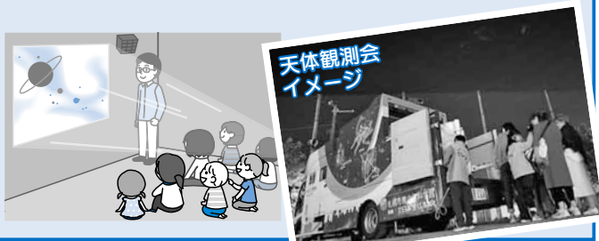
天体観測会イメージ

4 残念ながら当日は悪天候。屋内でのスライドショーに変更になりましたが、青少年科学館職員の解説が面白いと好評でした。来年こそ天体観測ができるよう、実施の計画を立てているようです。