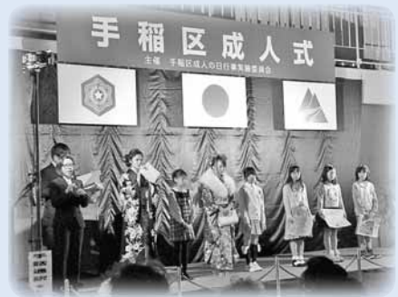
▲平成26年手稲区成人式の様子