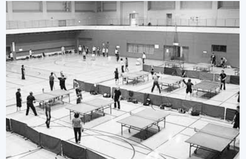
▲体育館は大勢のスポーツ愛好家で大にぎわい。2階がランニングデッキ

また、体育館にランニングデッキがあるのをご存じだろうか？ランニングを楽しむみたいけれど、雪の上を走るのはちょっと…。という人はぜひ、ここを利用してもら