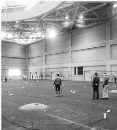
▲土ならではの感触を楽しめる

また、月2回ほど、幼児・小学生と保護者向けにアリーナを開放している日があり、本格的にスポーツをするには早い、小さな子どもでもいる家庭でも気軽に利用できる。子どもと一緒に体を動かして、冬の運動不足を解消してはいかが。