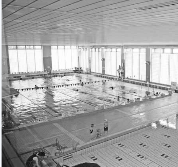
▲幼児用プール(写真手前)もある