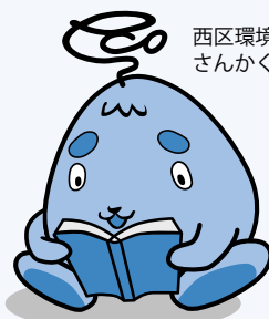
西区環境キャラクターさんかくやまベエ

一人一人が暖房や照明を使うのではなく、家族や仲間同士で一つの場所に集まったり、外出したりすることでエネルギーを節約する、冬の新たなライフスタイルのこと。省エネ・節電につながるだけでなく、人とのコミュニケーションも深まるよ!