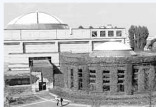
▲大小2つのドームが目印