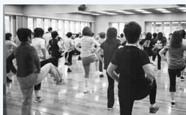
▲「自由参加プログラム」の一つ、大人気のアロビクス

このほか、常駐する専門スタッフの指導を受けながら、個人の健康状態や目的に合った運動メニューに取り組むことも可能。メニューの作成には、中央健康づくりセンター(中央区南3西11)で実施している「健康度測定」(有料・要予約)を受ける必要がある。詳細については問い合わせを。