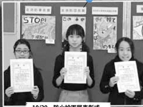
10/29 防火絵画展表彰式 ～北九条小学校