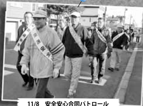
11/8 安全安心合同パトロール ～新琴似西地区