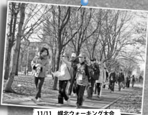
11/11 幌北ウォーキング大会 ～北大構内