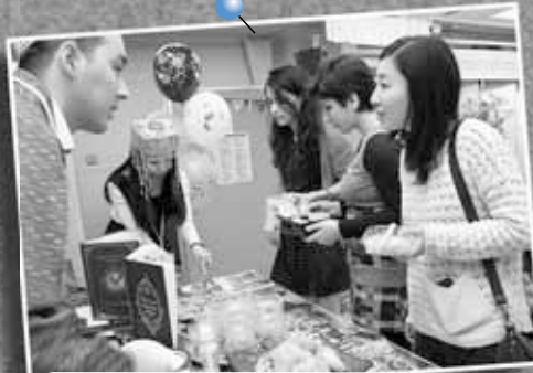
11/1 に～よん国際ナショナルカフェ ～札幌サンブラザ