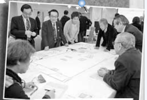
11/6 北区まちづくり協議会全体会 避難所運営ゲーム～札幌サンブラザ