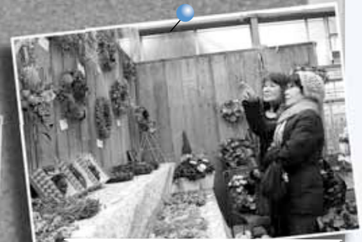
11/18 クリスマスディスプレイ展 ～百合が原公園