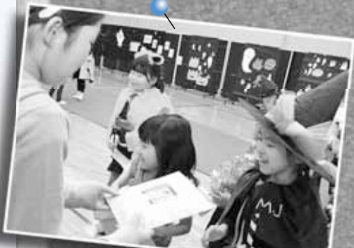
10/31 ハロウィンウィーク仮装コンテスト ～屯田児童会館