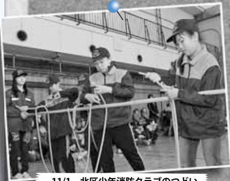
11/1 北区少年消防クラブのつどい ～札幌市消防学校