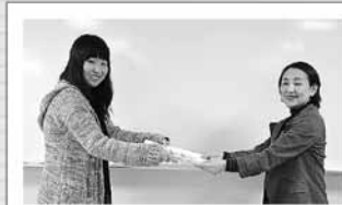
原画引き渡し式の様子

区内の小・中学生から募集した食育川柳を基に、札幌大谷大学の学生が絵札を描きました。