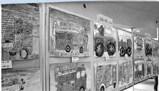
会場に展示された受賞作品