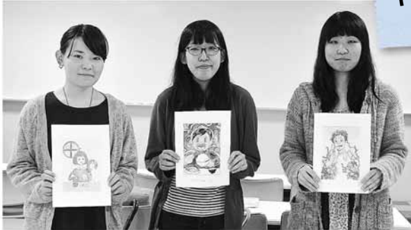
絵札の原画を描いた札幌大谷大学の学生