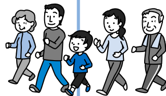
まちづくりセンターから百合が原公園までウォーキング