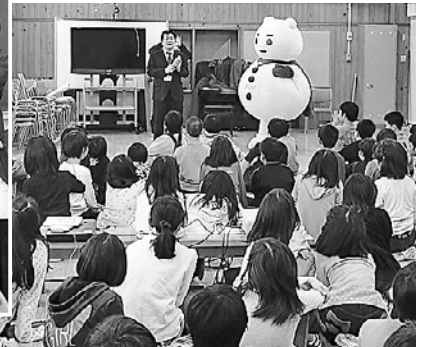
▲昨年の除雪出前授業の様子