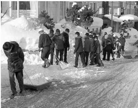
▲40分ほどかけて雪を運び出します

積雪時の通学路は、車1台通るのがやっとで、通学に支障がありました。そこで、生徒会や部活生徒を中心に、ボランティアで参加した1・2年生が、荒井山や円山西町など付近の町内会の方々や、土木センターの職員にもお手伝いいただき、毎年2月に1回、雪が多い年には2回除雪しています。生徒たちは、「固くなった雪を運ぶのは大変だけど、やり遂げると気持ちがすっきりするし、みんなが安心して通えるようになるのはうれしい」などと話しています。放課後の活動なので、部活動との調整や日没前に終わらせなければならないなど、時間調整が大変ですが、地域の方も通り、小学校の通学路にもなっているので、中学校だけではなく地域の役にも立っている活動だと思います。