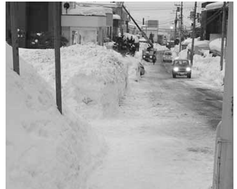
▲すっきりきれいになった通学路

生徒たちに、除雪をしながらボランティアの「心」も学んでもらえればという思いで、当初から参加しています。スコップの使い方など、最初はおぼつかないような生徒もいますが、さすが若者！パワーがあるので、ゲーム感覚で雪をどんどん片付けていくのは頼もしいですね。また、地域で参加している人には、日ごろの運動不足解消にもなっているようですし、普段あまり接する機会のない生徒たちや隣の荒井山町内会の方々ともコミュニケーションを取ることができます。学校と地域、行政の三者が一緒になって除雪に取り組んでいることで、いろいろなことにつながっていると感じています。