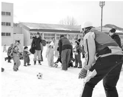
▲ 昨年の様子 (左：体育館での室内遊び、右：グラウンドでの外遊び)

住まいの方(就学前のお子さんは必ず保護者同伴でご参加ください)。 ▽持ち物・服装 上靴(親子とも)、外靴を入れる袋。親子ともに上下スノーウェア・手袋・帽子・長靴などを着用し、暖かい服装でお越しください。 ▽費用・申込 無料・不要。当日、直接会場へ。 当(詳細) 健康・子ども課子育て支援係 ☎(511)6399