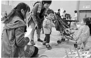
▲▶楽しいコーナーでみんなが笑顔に

中央区民センター（南2西10）において中央区子どもまつりが開催されました。各コーナーでは、射的やヨーヨー釣りのほか、中高生のリーダーが企画と制作に関わった「リアル脱出ゲーム」やお化け屋敷などが大人気。参加した子どもたちは、笑顔の絶えない楽しい一日を過ごしました。