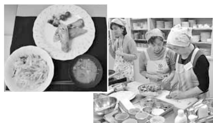
▲手際よく調理する参加者

中央保健センター（南3西11）においてみんな元気!! 食育体験レストラン 地産地消のどさんこ料理教室が開催され、30人が参加しました。