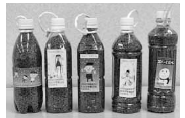
▲砂入りペットボトル (コロバースボトル)