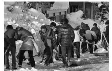
▲除雪ボランティア