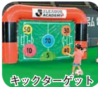
キックターゲット