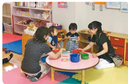
ままごとで遊びながら、楽しい会話が弾みます。