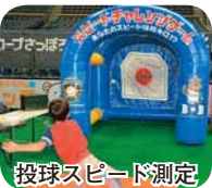
投球スピード測定