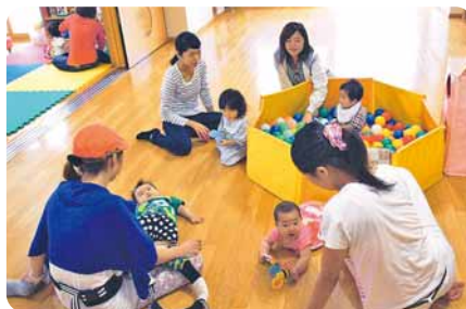
人気のボールプールには自然と親子が集まります。

子育て家庭が自由に集い他の親子や地域の方と交流することができます。保育士や子育てボランティアが見守る中、広々としたスペースでいろいろな遊具を使って遊ぶことができ、赤ちゃんから幼児まで楽しめます。保護者同士の情報交換の場としてもお気軽にご利用ください。