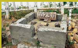
▲山頂にある三角点

春・夏・秋・冬と 変わる山の姿や周りの景色、そこに生息する生き物や草花など、手稲山にはまだまだ知られていない魅力がたくさんあります。自分だけの手稲山の魅力を探して家族や友人に自慢してみませんか？