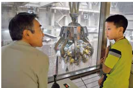
▲ごみクレーンは迫力満点

各家庭から排出される生ごみの水分を減らすと、ごみが燃えやすくなって発電量が増えます。市全体で水分を10%減らすと、一般家庭1,500軒分の年間消費電力に相当する電力が生まれます。