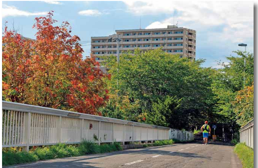
▲「ひと足早い、秋」 撮影日：平成26年9月12日 撮影場所：白石サイクリングロード