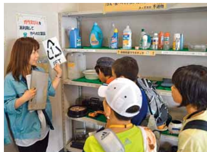
▲ペットボトルの識別マークを確認