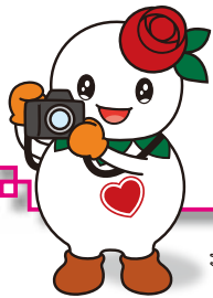
マスコットキャラクター「しろっぴー」

区内で撮影した風景写真「しろいしな風景」を募集しています。ご応募いただいた写真は、区役所ホームページやこのコーナーなどでご紹介します。募集要項は、区総務企画課広聴係と区内各まちづくりセンターで配布しているほか、区役所ホームページに掲載しています。内容を確認の上、ぜひご応募ください。