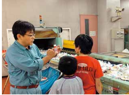
製品プラスチックとの違いを勉強

このセンターでは、容器包装プラスチックを選別し、リサイクルしやすいように加工しています。加工されたものは、公園のベンチやくいなどにリサイクルされています。しかし、燃やせるごみとして捨てられる容器包装プラスチックも多くあり、その量は年間約1.6万トンにも。また、リサイクルできない製品プラスチックと一緒に出されることもあります。