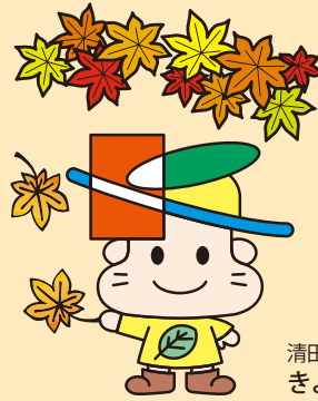
清田区マスコットキャラクター きよっち