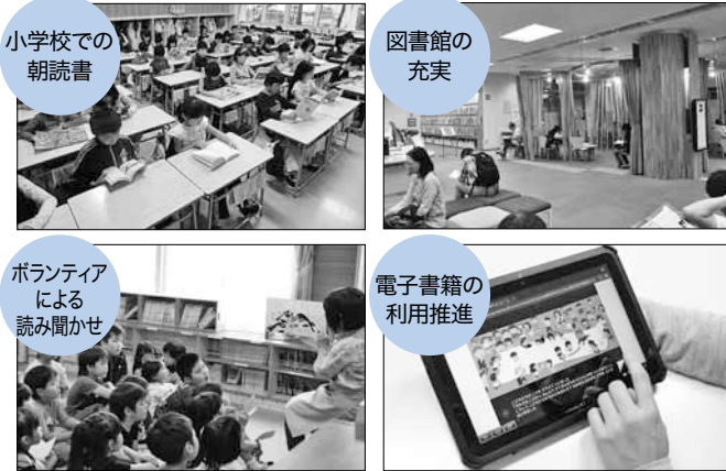
小学校での朝読書